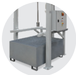
Bac de rétention pour IBC